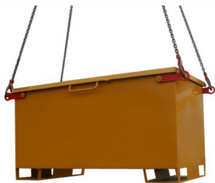
Modèle 750 L

Possibilité d'équiper le coffre de chantier de 4 roues pivotantes pour permettre sa manipulation par un opérateur au sol.